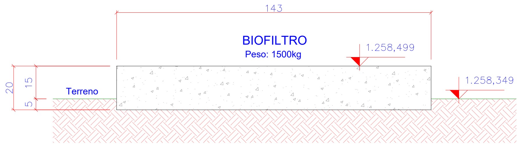
2 BIOFILTRO - CORTE AA ESCALA 1:10